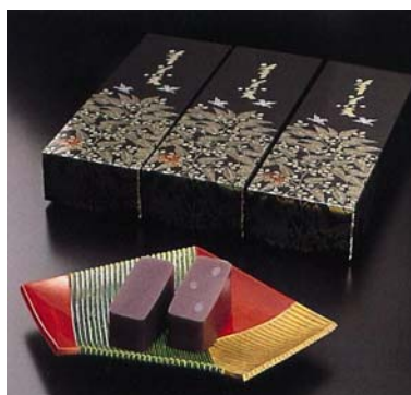
「黒羊羹」(くろようかん) 羊羹の最高峰。かつて加賀藩士の紋服「黒梅染(くろめぞめ)」の高貴にたとえられたその艶は、大藩加賀の羊羹造りの伝統を未来へ語り継ごうとしている。

この新工場への過大な投資が重くのしかかり、森八の財務体質は急速に悪化していく。実はすでに昭和50年代後半から、森八の経営は慢性的な赤字に陥っていた。ブランド力と商品力のみ依存した安直な経営手法はとっくに限界に来ていた。やがて、本社用地をはじめとする所有不動産の評価額がバブル崩壊で暴落し、担保価値が大幅に下落した。取引金融機関が新規の融資を手控え始めたことで資金繰りが急速に悪化し、経営危機が表面化していくことになる。