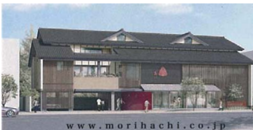
森八 大手町新本店 (イメージ図)