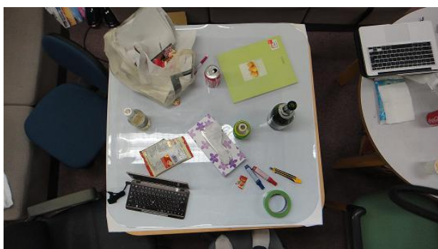
図3 図2のデスクトップ表示の元となった談話スペースのテーブルの状態

また C) のようにデスクトップを普段使わない利用者も見受けられるため、整頓状況を提示する対象についても検討する必要がある。