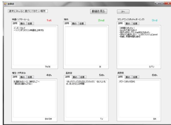
図 5 閲覧用インターフェース