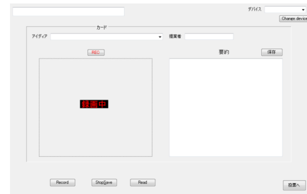
図 3 議論フェーズの USB カメラ撮影と要約