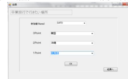
図 4 投票フェーズのインタフェース