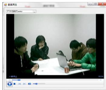
図 6 動画再生インターフェース

カッションの要約、ビデオ映像（図 6）を提示する。この順に情報量が多くなり構造化された議事録が作成できる。