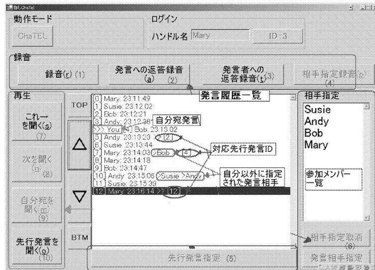
図3 ChaTELのユーザインタフェース

スの発言履歴に追加される。発言を聴取する際は、発言履歴上から聴取したい発言のメタデータを選択してダブルクリックすることなどにより、サーバから音声データをダウンロードして、再生する。このように、ChaTELは通常のテキストチャットを単純に音声化したようなコミュニケーションメディアである。