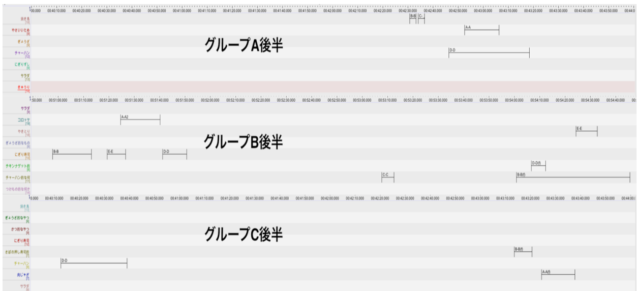
図 4 すべての大皿料理に対する取り分け行動分布状況 (上段：前半 (10-15分), 中段：中盤(25-30分), 下段：後半 (食事終了10分前))