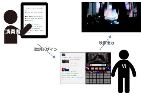
図 4 システム全体像

本研究で構築したプロトタイプシステム LyricVJ について述べる。システム使用手順の概要を図 4 に示す。はじめに演奏者は歌詞に対して視覚的なデザインを行い、曲の雰囲気や VJ に伝える。VJ は視覚的にデザインされた歌詞を受け取って、それをシステムに入力する。そのデザインされた歌詞を UI の中心に置き、VJ はあらかじめ歌詞の上に画像を配置し、楽曲構造を意識した VJ 表現の全体デザインを行う。こうしてデザインされた、歌詞とその上に配置されたサムネイル画像からなる VJ 操作インタフェースを用いて、本番のパフォーマンスで映像を出力・操作する。本システムの各内容を以下に説明する。