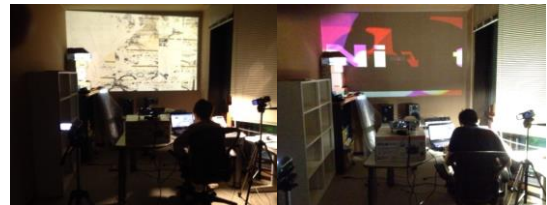
図 2 VJ 表現制作支援ツールの印象評価実験 Figure2. Evaluation Experiment of VJing production support tools

被験者は楽譜を読むことができる者、読めない者各 4 名ずつの合計 8 人であり、全員が VJ 未経験者である。被験者は、白紙のメモ・楽譜・歌詞カードとペンを使用できる状態で、楽曲 3 曲に対して VJ ソフトウェアを使用し、音楽に合わせて映像を選択した (図 2)。