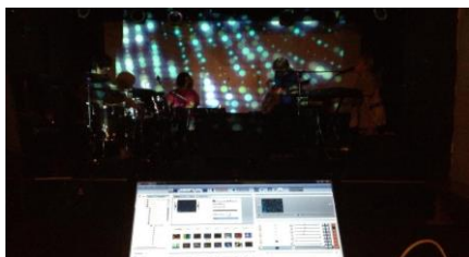
図 1 VJ について現地調査

第 1 著者自身も VJ 体験をし、ビデオ撮影を用いて演奏者から VJ 表現のフィードバックを得た (図 1)。バンド演奏に対する VJ 体験では、リズムや曲の雰囲気が頻繁に変化することから、納得感のある VJ 表現を行うことが難しかった。第 1 著者による VJ 表現へのフィードバックとして、演奏者から歌詞の意味合いとそれに伴うイメージを伝えられたことから、演奏者は歌詞と映像のイメージを結び付けている場合があることがわかった。