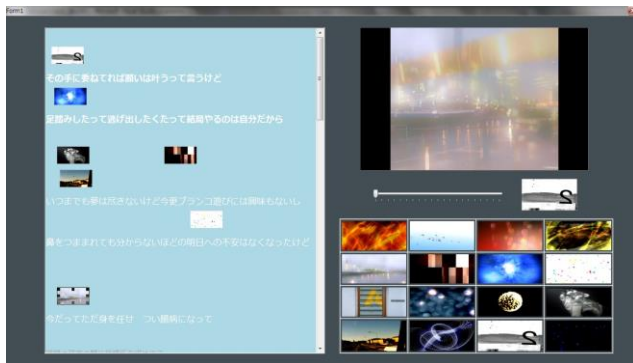
図5 実験で使用したシステム Figure5 System Used in Experiment

今回の実験ではLyricVJの機能として、サムネイルの配置、サムネイルクリックによる映像出力、映像の透過処理、映像のプレビューを使い、実験を行った(図5)。はじめに被験者は曲を聴き、メディアプールにある映像を確認しながら、映像のサムネイルを歌詞インタフェースに挿入し、選択する予定の映像群を歌詞上に配置し、VJの全体構成をデザインする。サムネイル画像の配置を終えた後に、被験者は曲に合わせて歌詞の上に配置されたサムネイルをクリックする事で映像を切り替えて、VJ表現を行う。また、被験者には思考発話法を実践するよう実験前に伝えている。