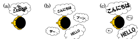
図 1 聞き取りやすい補聴器で聴こえる音のイメージ

要な情報であるといえる。普段の生活の中で利用される補聴器には、他の手がかり以上に到来方向の情報を用いて、聞き取りやすい補聴器とすることが望ましい。したがって、聞き取りやすい補聴器を開発するためには、目的の音の聴取を容易にするために重要な音響的特徴の中でも、音の到来方向による音響的特徴の影響を明らかにすることが特に求められている。また、音の到来方向の判断には、頭部の動きによる動的な音響的特徴が重要であることが知られている。そのため、目的の音の聴取を容易にするために重要な音の到来方向による音響的特徴も、動的な音響的特徴であることが重要であると予測される。