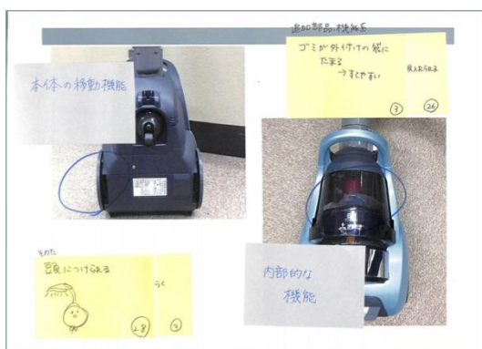
図7 参考資料に盲点を明記させる Fig. 7. Describing blind spots.