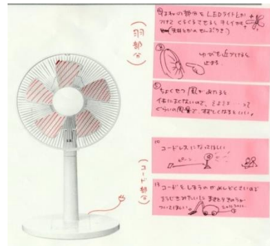
図1 アイデアのグループ化：各付箋をその対象となった扇風機の部分要素に対応づけてグループ分け

1度目のブレインストーミングでは、扇風機を構成する全ての構成要素にわたるアイデアを網羅的に抽出することができなかった。さらに、アイデアを書き出した付箋を被験者自身で内容ごとにグループ分けを行っても、見過ごし要素の存在に自力で気づくことはできず、その後に指示されて実施した見過ごし要素の洗い出し作業を経て、はじめて見過ごし要素の存在を認識することができた。「アイデア