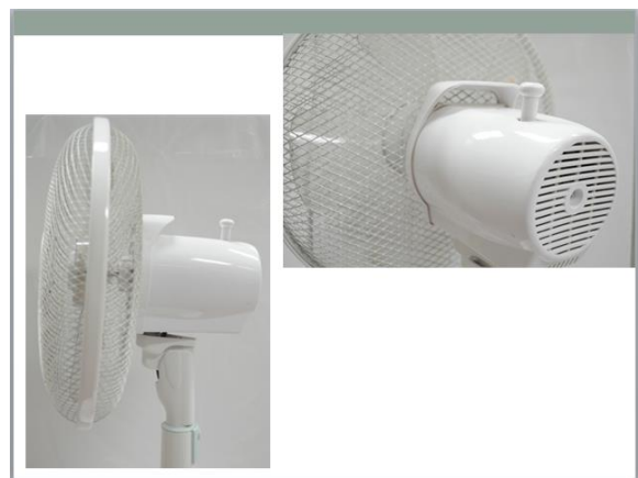
図5 被験者に提供した参考資料の一部