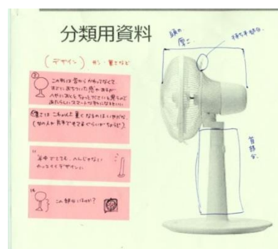
図2 見過ごし要素の洗い出し作業結果。図中の青ペンで書き込まれた部分のアイデアが生成されていない。