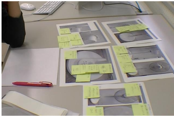
図6 アイデアのグループ分け Fig. 6. Grouping pieces of idea.