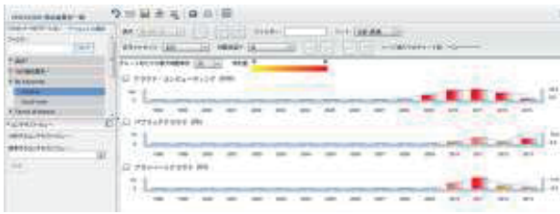
図2. 偏差分析例 (クラウドコンピューティング)