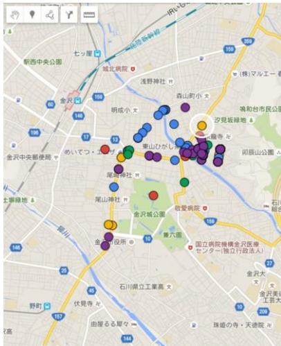
図4 マッピング結果. マーカーの色は、赤：「はあ」、黄：「ひい」、緑：「ふう」、青：「へえ」、紫：「ほお」に対応

たところ、その意味づけもそれぞれに異なる多様なものであったことが明らかになった。例えば、「はあ」は腑に落ちない時以外にも、感心した時や、疲れた時にも使用されていた。上述の電気店の古い看板に対して使用された「ひい」は、現在では消滅してしまった会社のブランド名が書かれていた事に対して驚いた時に使用されていた。また「ほお」は、納得した時以外でも、休憩時のため息や、感嘆をおぼえた時にも使用されていることが分かった。