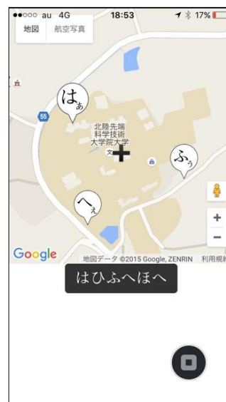
図 3 閲覧画面

市の主要な観光地である「ひがし茶屋街」を開始地点とし、本稿著者のうちの 4 人で試用実験を行った。実験に使用した端末は、4 人がそれぞれ普段から使用しているものである。端末の機種は iPhone 5S×2, iPhone 6, ARROWS NX F-05F (Android OS) を使用した。メンバーはスタート地点からそれぞれ散らばり、各個人のタイミングで「はあ」、「ひい」、「ふう」、「へえ」、「ほお」をそれぞれ選択して、データを蓄積した。実装したアプリケーションの動作状況に関しては、iOS 端末では目立った問題はなく、Android OS では動作が遅かったものの、入力には問題なかった。