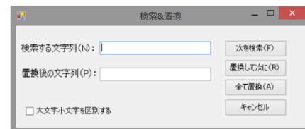
図 2. 検索・置換機能画面

以下、棄却テキスト断片が収集されるべき各操作が執筆者により実行されたときにおける棄却テキスト断片収集エディタの処理手順について説明する。