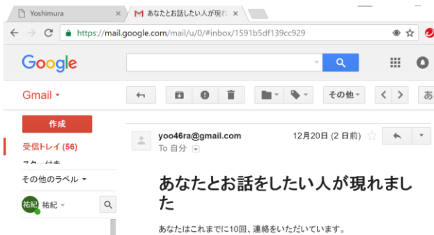
図 3 通知画面