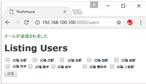
図 2 話したい相手の選択画面