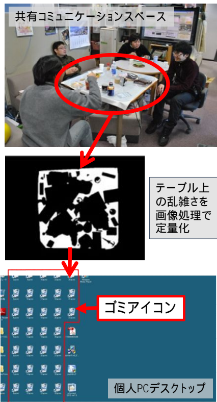
図 2 TableCross のシステム構成

目的としたシステムである。図 2 上の写真は、筆者らの研究室の中に設置されている共有コミュニケーションスペースである。ここは誰でも随時自由に集い、様々な談話や議論を行う場として日常的に活発に利用されているが、利用後にゴミを片付けずに放置する者があとを絶たない。