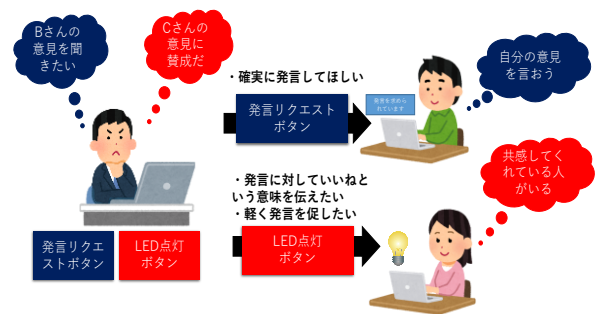
図 1. LighthouseChat に付加された機能 Figure 1 Additional functions of LighthouseChat

この機能は、特定の参加者に対し、その参加者のクライアント端末に付加された LED を点灯させるだけという、非常に曖昧な形態でなんらかの意図を伝えるための機能である。クライアントシステムが稼働している各パソコンには、LED を付加した Arduino UNO がシリアル通信で接続され