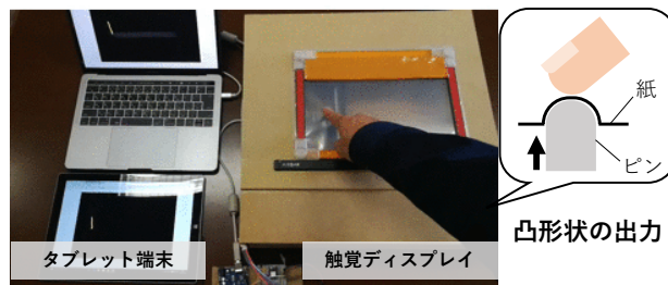
図1. 開発したシステムの概要

中途視覚障がい者を対象とし、中途視覚障がい者と健常者の共同作業について、参加者同士の交流が促進された。視覚情報と触覚情報の相互変換は健常者に対して視覚障害者の支援を容易にするなど、中途視覚障害者と健常者の両者の支援が可能になった。一方、視覚障がい者は、その障害の段階によって支援内容が大きく異なることが考えられる。視覚障がい者の障害レベルに適応したユーザインタフェースの改善が必要である。また、本研究を通して得られた知見に基づき、現在、共同絵画以外に、共同切り絵を対象に研究を進めている。