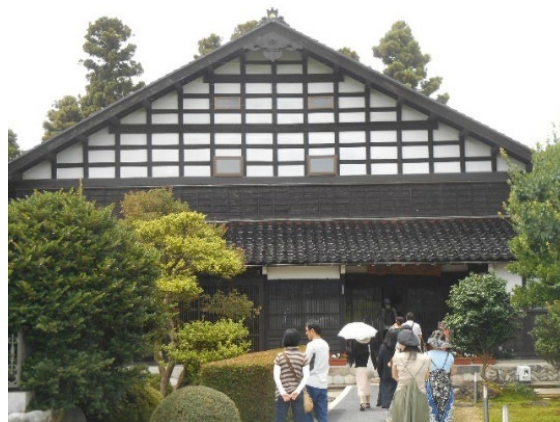
図 2 レストラン大門の入り口（築 122 年の母屋）。家々が孤立しているため、このような伝統的な家屋には暑さ対策として大きな屋敷林（カイニョと呼ばれる）がある。

提供される料理は、昼の部では伝承料理（となみ野の伝統料理）を中心としており、「ゆべす」（金沢では「べっこう」とも言わ