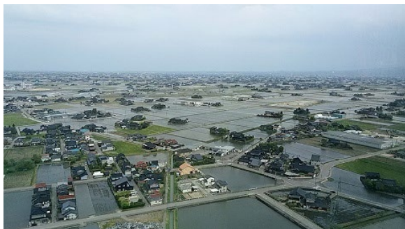
図 1 砺波平野（庄川流域）の散村風景。写真中央から奥へと広がる田畑の中に母屋が点在する様子が分かる（クロスランドおやベタワー展望フロアより）。 [5]

この地域の散村の成立要因については、i) 庄川の扇状地に位置しているため地表土が薄く洪水を避ける必要を考慮してできるだけ耕土の厚い所・地盤が良い所に住居を建てその周辺を開拓した、ii) 雪国なので家の近くに田畑があると降雪時期の収穫が楽であった、iii) 幕府の年貢計算をあいまいにするために家々の領土境界を分かりづらくした、など諸説が考えられている [4] 。なお、同じように広大な扇状地形を有する石川県手取川流域は散村形態ではなく島集落（集村）形態であり、その成立要因は暴れ川と称され