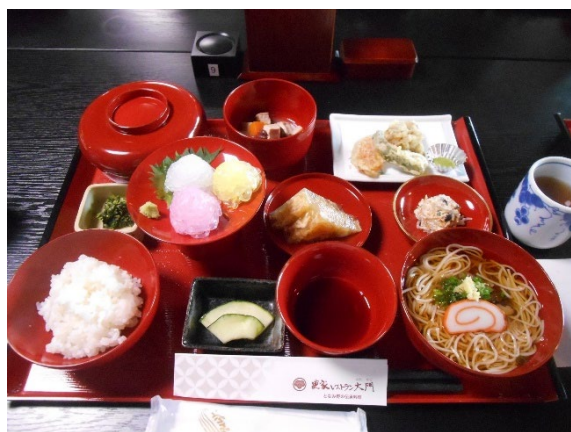
図3 レストラン大門の伝承料理(白雪姫)

レストラン大門は、観光の目的地にもなれば、近郊の観光とともに立ち寄る経由地ともなりうる。伝統的な佇まいの空き家の利活用と地域で普段慣れ親しまれてきた伝承料理の継承の両方を実現しながら地域の賑わい創出に貢献している先駆的な事例の一つといえる [7,8] 。女将さんによると、課題としては、年間を通じて安定的した来客・収益を確保すること(12~3月は天候の影響が大きい)