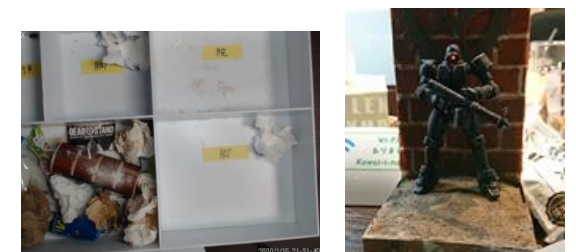
被験者 X Subject X