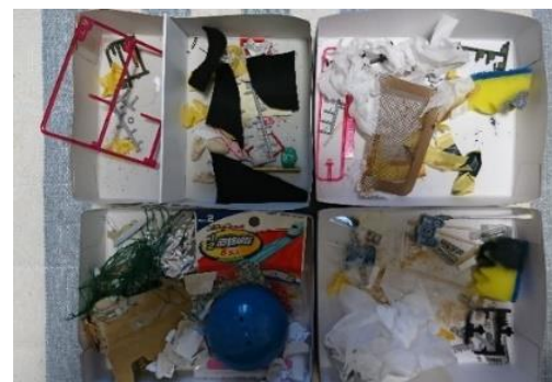
図2 参考にする不用物画像 Figure 2 Unused materials image to be referred to

ここでプラスチックモデルを改造する場合にどのような種類の不用物が表出されるかを解説する。素組みで生じる不用物は、パーツの集まりの枠（ランナー）や、切り取った跡等である。一方、改造を行う際に生じる不用物は、市販されているプラスチックモデル用の素材に由来するものもあれば、100円均一ショップで調達した日用品などに由来するものもある。そのほか、本研究では、改造を行う過程で使用した消耗品の道具等も不用物に含めた。