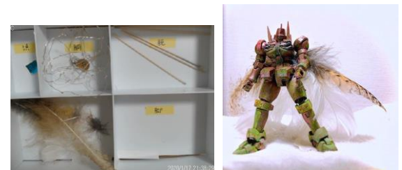
被験者 C Subject C