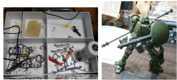
被験者 A Subject A