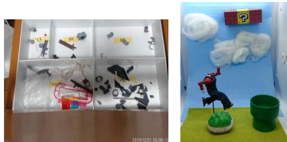
被験者 B Subject B