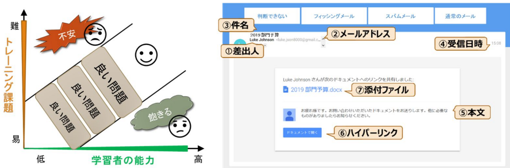
図 3. フィッシングメール判別トレーニング環境

セキュリティリテラシの中でも特にフィッシングメールに対する判別スキルをトレーニングするための課題出題手法を提案した。具体的には、トレーニング課題の難易度を実際に収集したフィッシングメールやスパムメールの事例から設定する手法を定式化し、前年度に開発したオーバーレイモデルと組み合わせることによって、学習者の判断能力のレベルに応じた課題出題を実現する手法を提案した。実際の事例に基づいて難易度を設定することができるため、新たなセキュリティインシデントの動向に対応した課題を容易に取り入れることが可能となった。