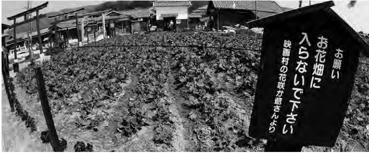
写真1 映画村の景観としての作物