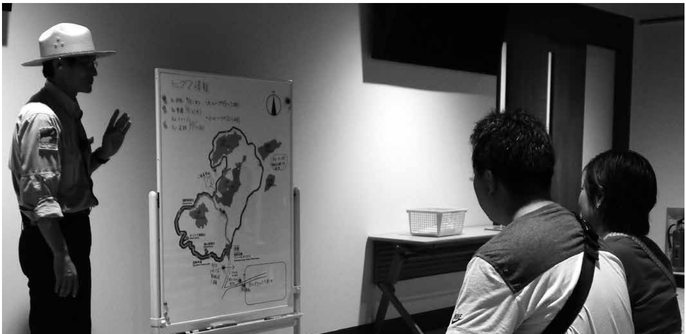
専門家の持つ豊富な知識は魅力

では、こうした地域からのリクエストに専門家はどうか応えてゆけばいいのだろうか。野生生物のことだけアドバイスしても、実際には「自分達の困っていることが分からない人」とか、「やはり生物しか分から