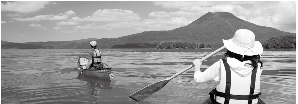
どの分野でも専門家の役割は重要

だけなら、患者が特定の疾患についてネットでも知識を得て、医師並みに詳しくなることはできる。しかし、それでは問題の解決、適切な治療をすることはできない。実際には、多数の患者を診てきた治療経験が必要である。医師の強力な診断支援システムとして期待されている深層学習(deep learning)の「ワトソン」も、過去の体験の膨大な治療結果の蓄積から学んでいる。 このように、専門的知識の多さだけでは専門家にはなれない。当該分野での経験が圧倒的に豊かである必要がある。正確に言えば、経験から得た知識を内省し、一般化しているかが問われる。さらに、豊富な知識を持つだけではなく、その場の状況に応じて「創造的な」問題解決ができることが求められる。それが単に知識を持っている(ため込んでいる)というだけではないことの証でもある(今井、2016)。