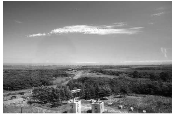
人工物がほとんどない空間である霧多布湿原

第2に、観光では「他者」との交流というメリットがある。福祉や環境まちづくりは、地域内関係者の関与がほとんどで、「よそ者」の関与は意外と少ない。しかし観光まちづくりであれば、地域外から来る観光客が、他者の視点で地域のことを評価したり、あるいは褒めたりするだろう。