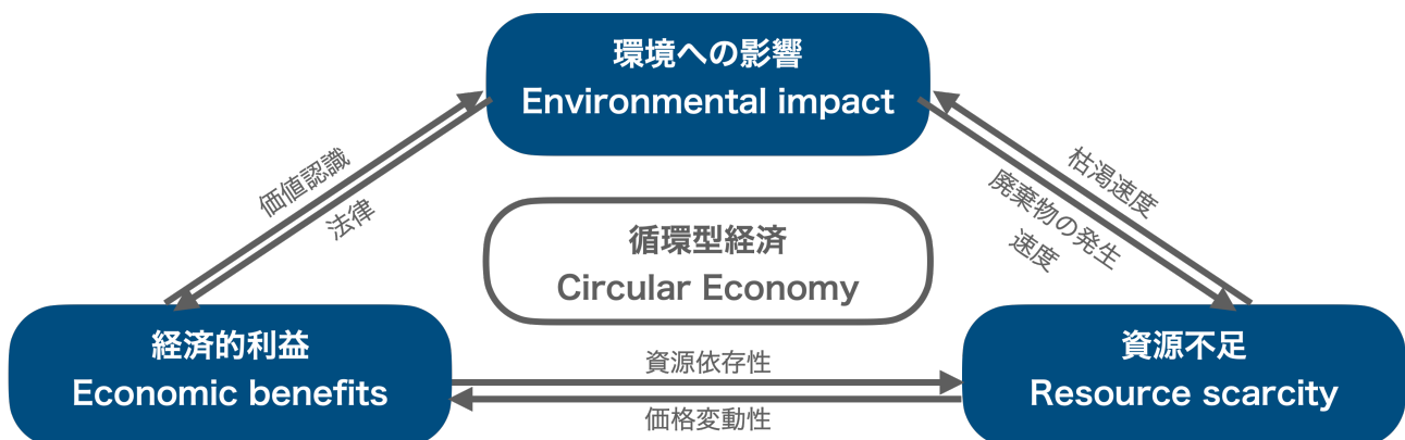
図1. 循環型経済を成功させるための要素 (Lieder & Rashid, 2016 に基づき筆者作成)

循環型経済の概念は、資源の枯渇、経済的利益の持続性、廃棄物の増加といった一連の問題に対する解決策として注目を集めている。しかし、この概念自体は新しいものではない。古くからリサイクル、リユース、リデュースの取り組みが行われてきた中で、多くの業界で循環型経済は既に実践されている。成功する循環型経済を実現するためには、環境への影響、資源不足、経済的利益という3つの側面を統合的に考慮する必要がある（Lieder & Rashid, 2016）。