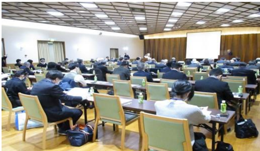
写真1 セミナー風景