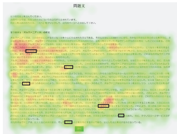
図 5 12 名の学内被験者から得た視線滞留時間の平均値に基づくヒートマップ

分析対象者 103 人の内、実験群と統制群それぞれで OST の成績が属する群の中央値以上である被験者 51 名を対象として、設問ごとの正答率と全体の平均正答率を求めた。結果を表 2 に示す。同音誤字を含まない文章を読んだ統制群 ( n=22 ) と同音誤字を含む文章を読んだ実験群 ( n=29 ) の全体の正答率の平均をマン=ホイットニーの U 検定を用いて比較したところ、 p < 0.01 となり、1%水準で有意差が認められ、統制群が実験群よりも有意に成績が良い結果となった。また、文中の同音誤字が正解と関係している 4 問 (設問 1, 3, 6, 7: 「あり」のみ) 全体の平均正答率をマン=ホイットニーの U 検定を用いて比較したところ、やはり 1%水準で有意差が認められ、統制群が実験群よりも有意に成績が良い結果となった。一方、同音誤字が正解と関係していない 2 問 (設問 2, 5: 「なし」のみ) 全体の平均正答率をマン=ホイットニーの U 検定を用いて比較したところ、