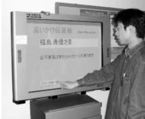
図4.3-3 Shadow Messenger

その宛のメッセージがあることのみを表示し、「読む」ボタンを押すことによって内容が表示されるようにしている。さらに、受取人がメッセージを読んだ場合や、有効期限切れで削除された場合などには、それらの情報が差出人にメールで通知され、メッセージがどのように処理されたかがわかるようになっている。