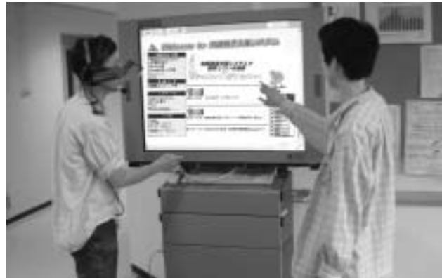
図 2.1-1 EMBS 利用風景

人間検知センサーの状態を監視し、検知したら画面を ON にし、設定ファイルで指定されているプログラム