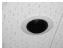
図3.1-1 EIRIS リーダ

知識科学研究科棟には約120個のリーダが設置されており(図3.1-3) 利用者の位置情報をかなり正確(室内は研究室単位、廊下は6~7m間隔)に特定することがで