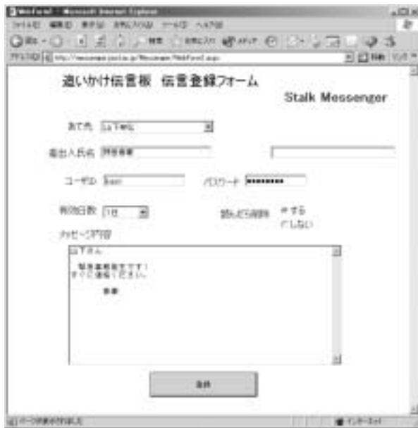
図4.3-1 メッセージ登録フォーム

EIRIS クライアント（位置情報を受け取り、メッセージがあれば EMBS コントロールサーバに指令を送るプログラム）と EMBS にメッセージを表示する Web サーバが1台のホスト上で稼働していることである。このようにすることによって処理の流れが非常に簡単になる。