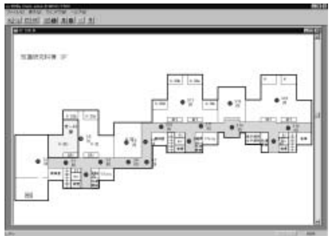
図3.1-3 EIRIS リーダ配置図

EIRIS には開発キットが付属しており、アプリケーションを開発することによって知識創造支援システムの各サブシステムと連携が可能となる。今後はこれらのサブシステムと連携したアプリケーションを開発し、例えばバッジ ID をユーザ認証に利用するとか、廊下など各所に設置されている EMBS を利用する際に個人を特定して情報を提示する、などのサービスを提供することが考えられる。