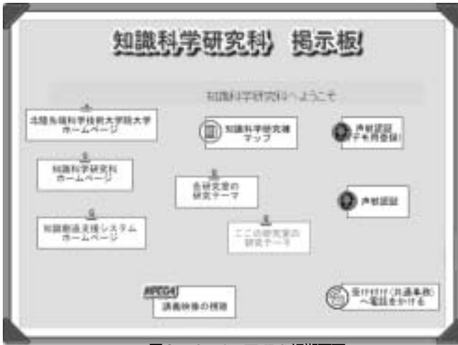
図2.4-1 EMBS 初期画面

の一つである。人間がアイデアを思いつく場所は机の前とは限らず、むしろ廊下やエレベータホールなどで他人と会話しているような時である場合が多い。そのような時に、ただちにコンピュータにアクセスして、必要な情報が得られることが重要である。EMBS は単なる掲示板ではなく、タッチパネルで操作することによって必要な情報にアクセスすることができる情報端末である。