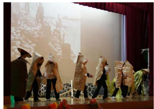
写真 3: 『災害とたたかう人々』