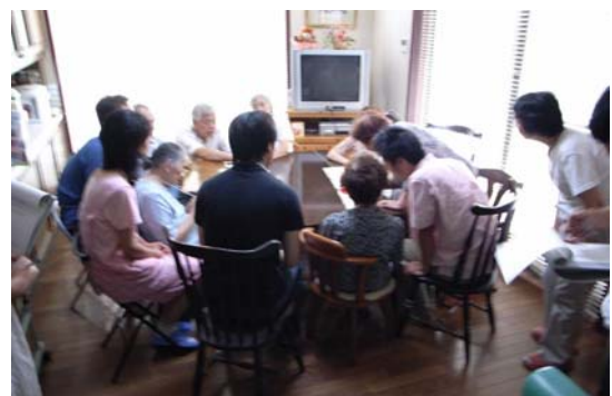
写真1: グループホームにおける回想法の実践