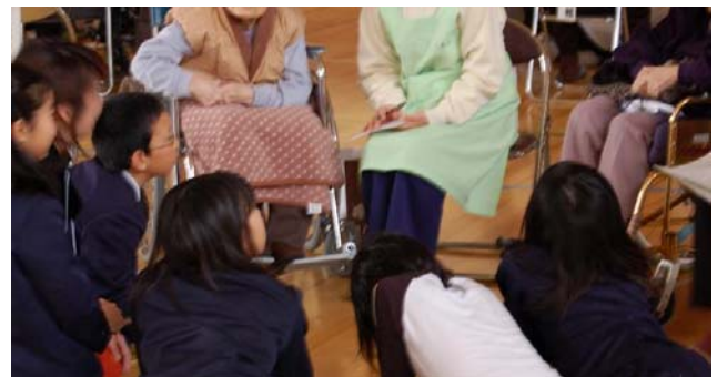
写真 4: セッション実施時の様子

展開した本プロジェクトの手法において我々が追究したのは次の点である。「回想法は話し手にとって楽しいだけでなく、聴き手にとっても重要である」[4]。聴き手になるのが、知っていることを問うような大人ではなく真に知らないことを知ろうとする児童であるがゆえに、記憶を呼び覚まされた認知症高齢者の語りは重要度を増す。実施して間に入った地域の大人、高齢者間の年代差も現われ、部分的に知らないことを伺いながら、児童と認知症高齢者をつなぐ支援の役割を自然と果たす形となった。