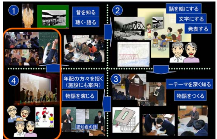
図1: モデル校区におけるプロジェクトの一連の流れ

が必要であることが見定められた。普段から関わりのある介護者や介護福祉の専門家だけでなく、むしろ現時点では関わりは薄くとも、これから増加が見込まれている認知症高齢者自身になることや家族、近所の住人として関わるが出てくるであろう人々の関わりや協力が得られる形で認知症高齢者を取り巻くコミュニティ形成のモデルを考案した。その際に、起点として位置づけられるのは、子ども達である。