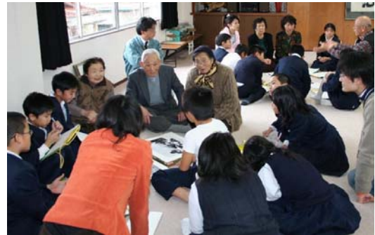
写真 2: 記憶を紡ぐ創作過程

道具を用いながら、校区の一般高齢者の回想内容を聴き取った。昭和の記憶を物語として紡ぎだす(写真3)。テーマを絞った聴き取りを進め、創作された物語は劇のかたちで上演された(図4)。あらためて児童は認知症高齢者を学校に招き、創作劇を用いて回想を促し、双方の関心を引き合わせながら対話するセッションの場を設けた(図5)。この一連の流れを実現し、認知症高齢者が社会参加の機会を得て、地域社会に受け容れられるための素地としてシステムの基本構図をつくり上げた。その際、回想法の発展形として