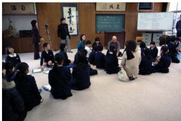
写真5: 子どもと共に地域で老いの価値を考える 造していくコミュニティ形成を促すものへとシステムをつくり上げていく必要がある。システムを補うプログラムとして、他者と共に老いてゆく価値を考える場を導入し、不自由を蓄えた生へのまなごしを地域で育むことへの方向性は示された。

本プロジェクトにおける地域社会のシステム構築は、その骨組みに加え、老いの価値をも問いながら予防事業に本質的な方向性を付与するものである。プロジェクトの一環として「老い」の捉え方をテーマに取り上げ、子どもと共に老いゆくことの価値を考える機会を設けた(図5)。授業参観時に保護者や一般高齢者も参加したワークショップである。おとぎ話を題材に、浦島太郎になったことを想像してなぜ老いたのか、老いることは罰なのか、そうしたことを考えた。村人の立場でも考え、浦島太郎がやってきたらどうするか、どのように迎え入れるかなどを話し合った。普段は教えるだけの大人、ひとつの答えを教わることに慣らされていく子ども、共に考える形で、それぞれのスタイルを変えてみる。そうして新たな考え方や価値観を創