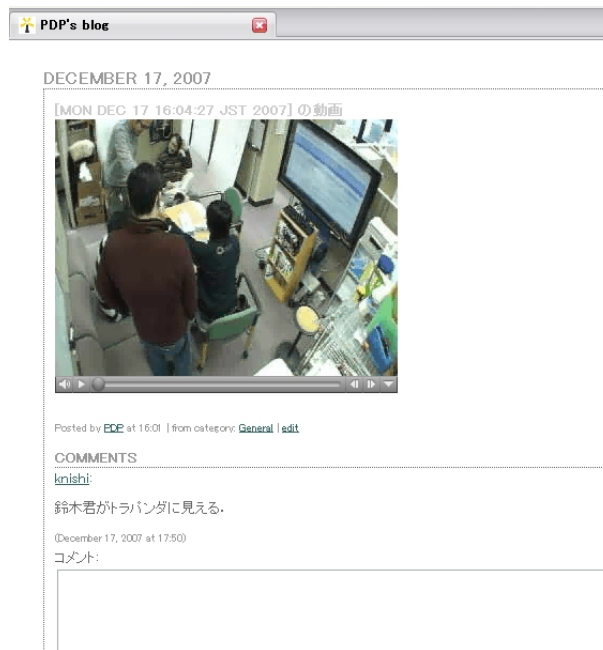
図2 Intrablog Server に投稿された記事

そこで、自動切り替えを手動で停止および再開させる機能を実装した。この機能进行操作するための入力デバイスとして、談話室に設置したYAMAHA Music Table MCT-90*5を利用する。Music Tableは、その名の通りテーブルの形状をしている。その卓面には12個の振動センサを内蔵したパッドが埋め込まれており、パッドを叩くとMIDI信号が送出される。このMusic Tableを、MIDIインタフェースを介してBCに接続し、任意のパッドをダブルクリックの要領で叩くと、BCからBSへの記事の要求を停止・再開できるようにした(停止と再開はトグルで切り替わる)。「ダブルクリックの要領で叩く」とは、単一のパッドを400ミリ秒以内に2回叩くことで