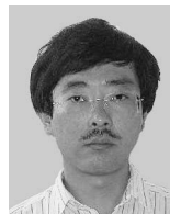
小川 瑞史 (正会員)

1948 年生。1972 年東京大学工学部助手、講師、電気通信大学講師、助教授、東京大学工学部助教授を経て、1993 年東京大学大学院工学系研究科教授(情報処理工学講座)、2001 年より同大学大学院情報理工学系研究科教授、現在に至る。工学博士。プログラミング言語、関数プログラミング、言語処理システムの研究・教育に従事。日本ソフトウェア科学会、日本応用数理学会、ACM 各会員。