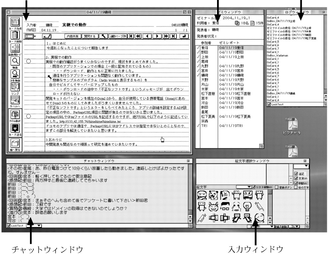
図 1 電子ゼミナールシステムの利用画面 Fig. 1 An example screen of electronic seminar system.

用には、操作権の取得は必要もなく、参加者全員が使いたいときに、いつでも使える。したがって、セマンティック・チャットの使用は、ゼミナールに関係ないインフォーマルなコミュニケーションにも使用可能となっている。