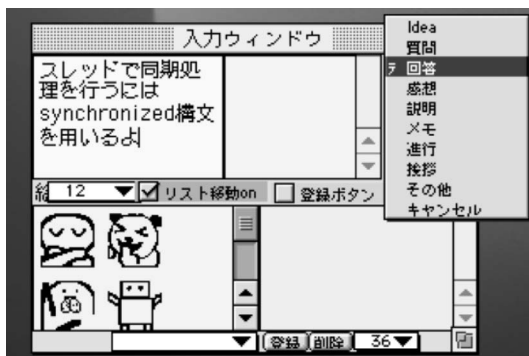
図 3 意味タグ選択インタフェース