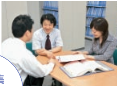
多彩な人材養成事業に取り組むキャリア支援室のスタッフ