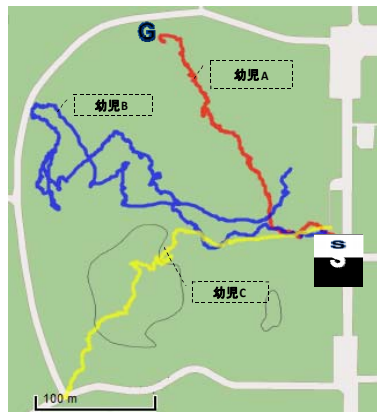
図9 地図 (Group ア)