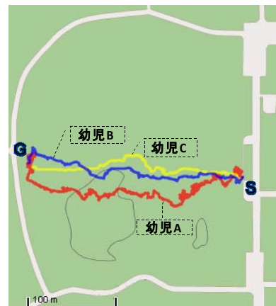
図7 本システム (Groupア)

また、実験中被験者にGPSロガーを持たせており、その経路を地図上にプロットしたものが図7、8、9、10である。