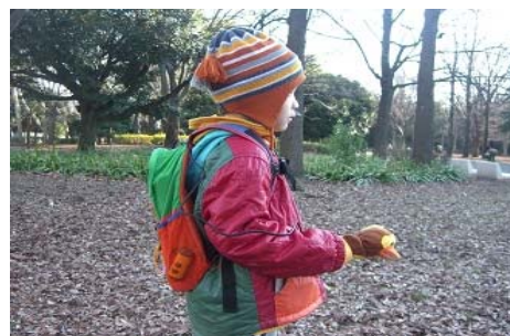
図5 本提案システムを装着したところ

次に、地図による情報提示により、保護者を捜してもらった。地図は公園発行の案内地図と、Google Mapsの光が丘公園全体図と、実験実施場所の拡大図をA4紙に印