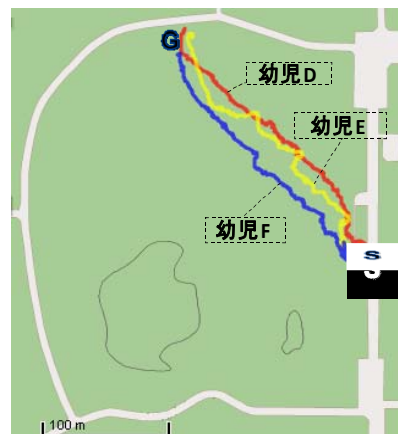
図8 本システム (Groupイ)