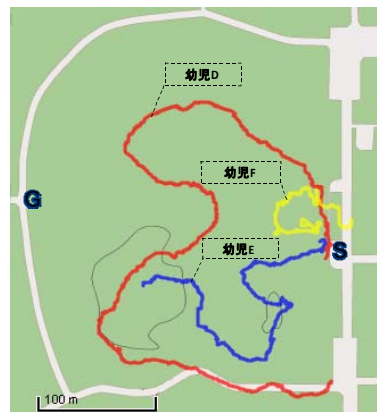
図10 地図 (Group イ)

本システムによる情報提示の場合、方向性を持って移動していることが見てとれる。他方、地図による情報提示は、1人を除いては、曲線を描いて迷走しているのが分かる。