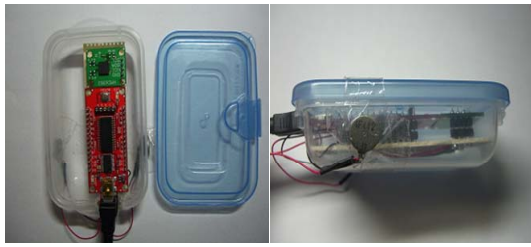
図3 実際に作成したデバイス

振動モータは容器の側面に装着した。これは、デジタルコンパスに対しモータを作動することで発生する磁界の影響を、小さくさせるためである。